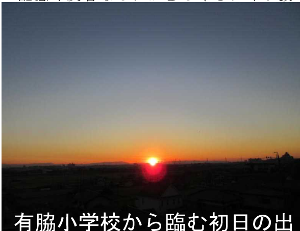
有脇小学校から臨む初日の出

「猪」は勇気と冒険の象徴でもあります。子どもたちには勇気をもって何にでも挑戦していく1年にしてほしいと思います。そしていつものとおり「一生懸命はかっこええ」を子どもたちとともに実践していきます。本年もどうぞご支援を賜りますようよろしくお願いいたします。