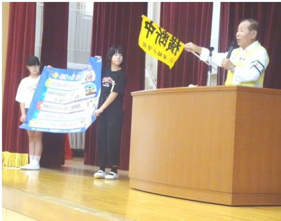
【体育館での設置式（スクールガードさんの話）】

9月11日、雨のため会場を体育館に変更して看板のお披露目式を行いました。看板は西昇降口前に設置され、これから1,2年生は毎日このお約束を唱えてから帰ります。この5つのお約束が、有脇の子どもたちを守る大切な宝物になることを願っています。