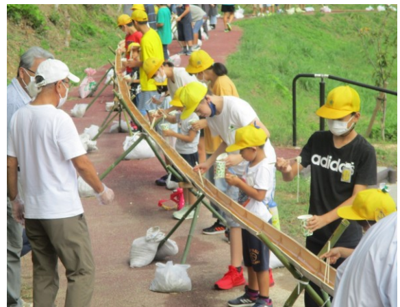
【初めての体験！おいしくて楽しい！】

衛生面に配慮しつつ、子どもたちの願いを叶えてくださった地域のみなさん、ありがとうございました。6年生の当日の活躍も立派でした。