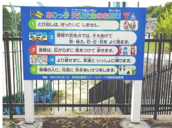
【「ありっ子 交通安全のお約束」の看板】