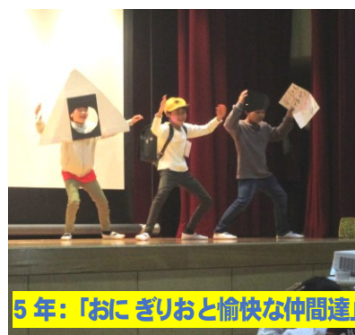
5年:「おにぎりおと愉快的仲間達」