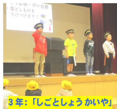
3年:「しごとしょうかいや」