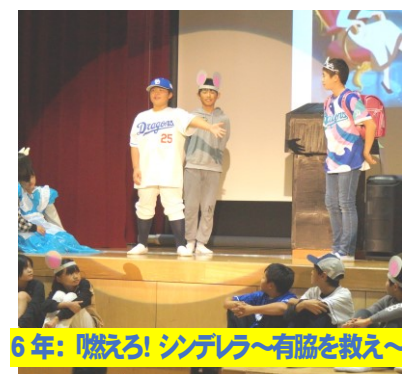
6年:「燃える! シンデレラ〜有脇を救え〜」