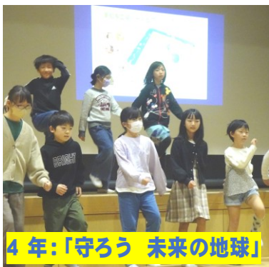
4年:「守ろう 未来の地球」