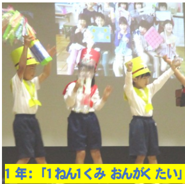
1年:「1おんくみ おんがきたい」

11月11日、学習発表会を行いました。久しぶりに全校児童と、保護者・地域の方が一堂に会しましたが、インフルエンザが増えてきていることもあり、ドキドキの会でもありました。近年、体育館でステージ発表という学校は少数になっているようですが、こんなにたくさんの方の前で表現できる子どもたちは幸せだと思います。これも小規模校のよさの一つですね。発表を終えて満足そうな子どもたちの顔を見ていると、大人も幸せな気持ちになれます。ご参観いただいた皆様、ありがとうございました。